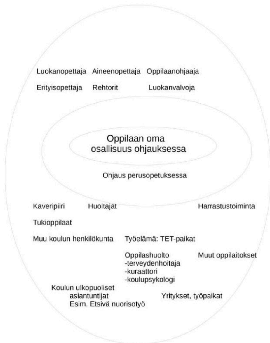
Kuva: Oppilaanohjauksen verkostot