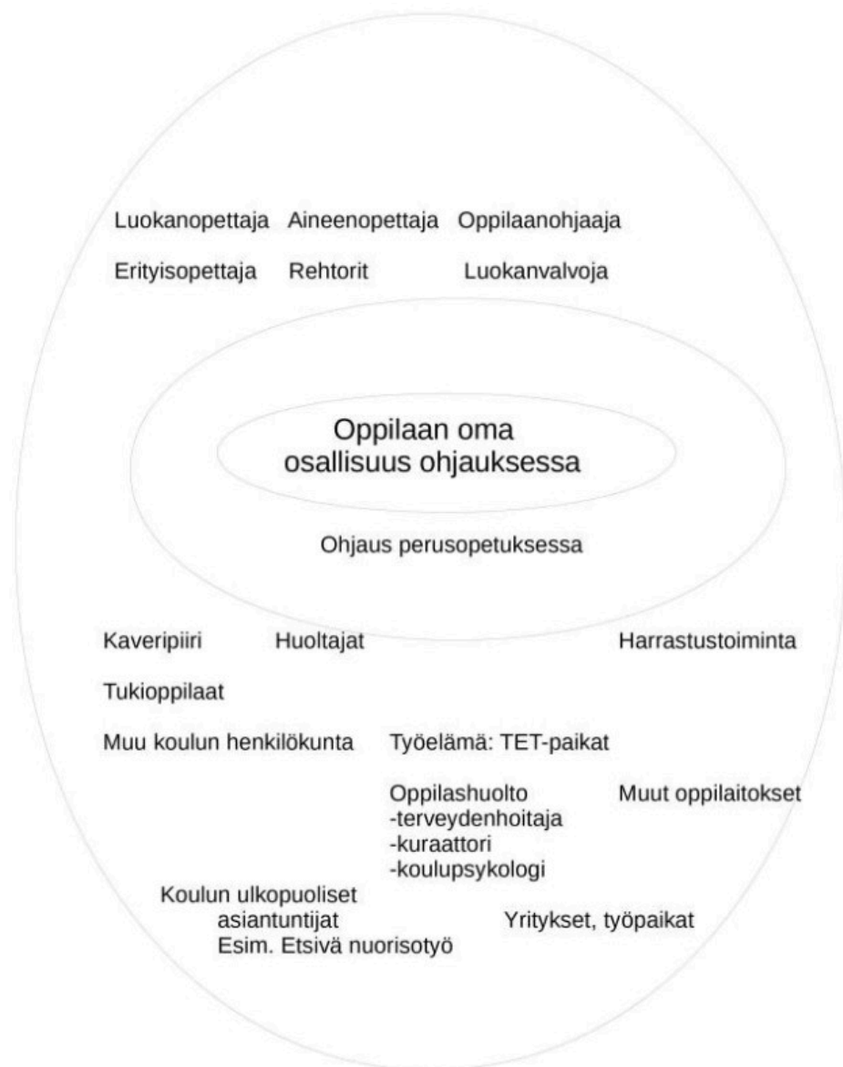
Kuva: Oppilaanohjauksen verkostot